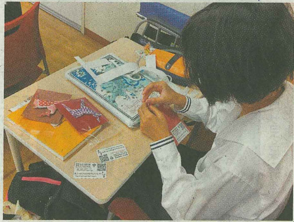
折り紙でシカを作る

点から考察した。調査結果を奈良公園の魅力として訪日観光客に伝えようと、18日、生徒たちは奈良公園でPR活動。タブレットを片手に英語で話しかけ、芝刈りをしない奈良公園の芝生が美しいのは、シカが芝を食べてだした糞(ふん)をコガネムシが分解し再び芝が生える循環ができています。シカがごみを食べたり交通事故で死亡しないために人のモラルが大切であること、長い歴